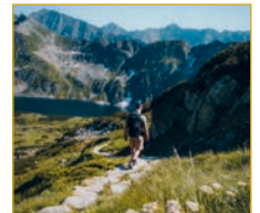
Wandern ist mehr als Bewegung