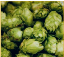
Hopfen Humulus lupulus

GESUND WERDEN – GESUND BLEIBEN – GESUNDHEIT NEU ERLEBEN