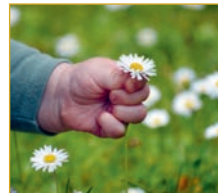
Gänseblümchen Bellis Perennis